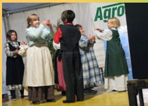
Naši folkoloristi plešejo.