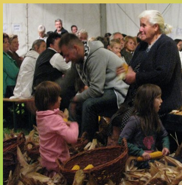
Obiskovalci pridno ličkajo koruzo.