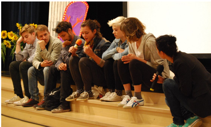
PO OGLEDU FILMA SO SLEDILA VPRAŠANJA, ZA IGRALCE FILMA.

V petek, 20. septembra, smo se trije učenci z mentorico in ravnateljico podali v Cerklje na Gorenjskem, kjer smo se udeležili podelitve nagrad za naj kulturno šolo. Šole, ki so dobile naziv kulturna šola, morajo razvijati obšolske dejavnosti na različnih področjih kulture, kot so: folklor, gledališka dejavnost, likovna umetnost, področji glasbene in plesne dejavnosti, literarna umetnost in novinarstvo, dejavnosti na področju filma in fotografije ter dejavnosti na področju varovanja kulturne dediščine. Med vsemi letošnjimi 53 šolami je naziv kulturne šole pripadel tudi OŠ Fokovci.