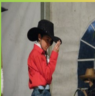
Domen, ki pleše kavbojski ples.