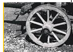
Najbolj prepoznaven kolarjev izdelek - leseno kolo, Kuzma, 1963

Kolarji izdelujejo lesene dele prevoznih sredstev, predvsem vozov. Pred leti so bili močno razširjeni, danes pa jih skorajda več ni. Zakaj je kolarska obrt začela izginjati?