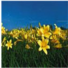
( Hemerocallis lilio-asphodelus ),